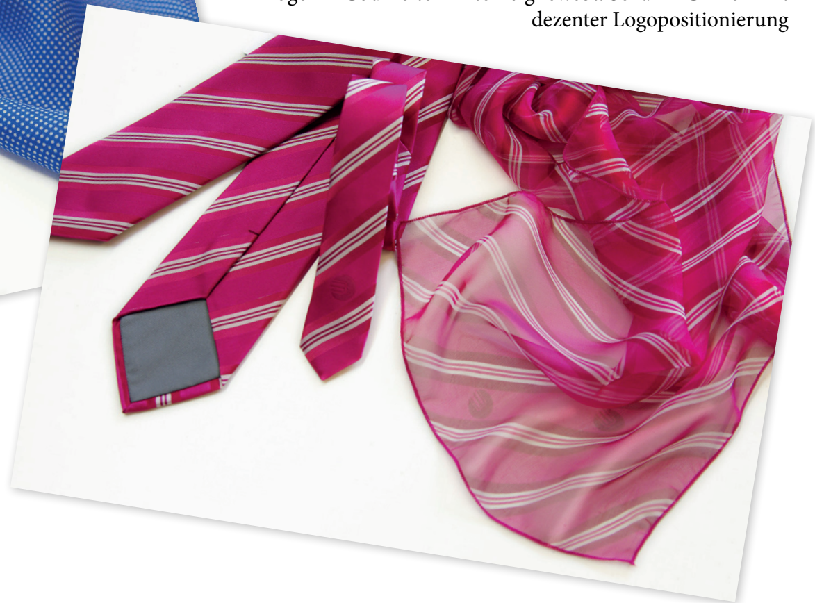
Krawatte aus italienischer Seide mit trendigen Streifen. Logo im Codino ton in ton eigneht. Schal in Chiffon mit dezentem Logopositionierung

Seidenschal passenz zur Krawatte in Seide/Modal.