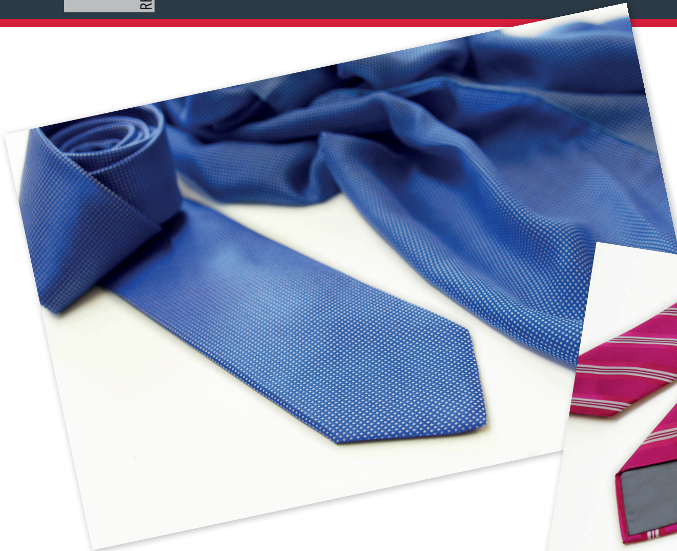
Krawatte aus italienischer Seide mit feinem Kleinmuster

Seidenschal passenz zur Krawatte in Seide/Modal.